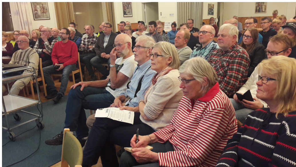
Intresserade deltagare i Kölabý församlingshem

Inledning ovan med bildpresentation av några av föreningens representanter som medverkade under kvällen.