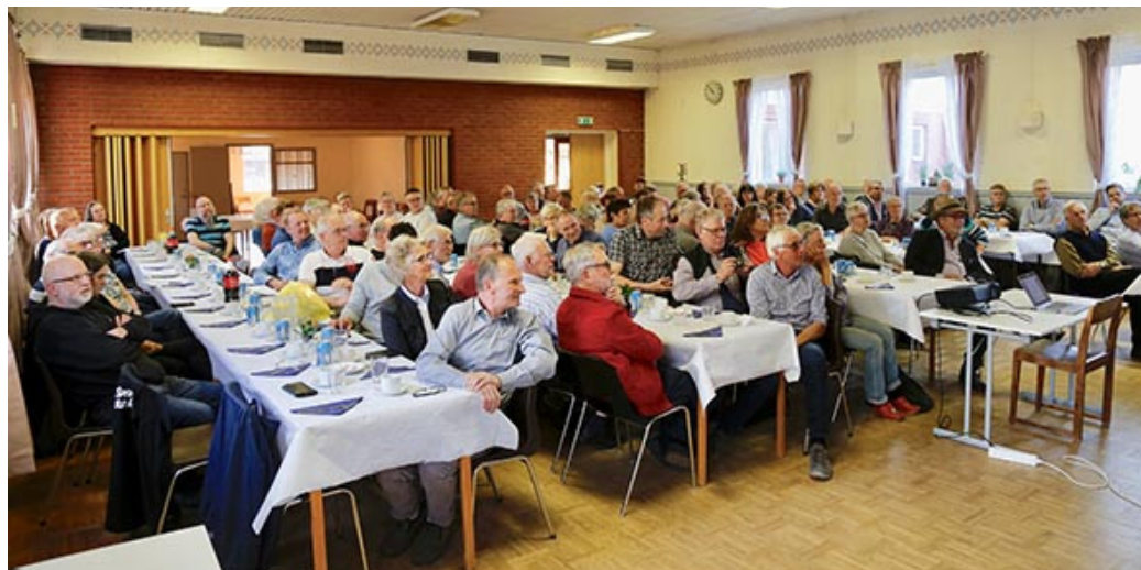
Ett hundratal intresserade stämmodeltagare i Vartofta samlingslokal

Innan första stämman för föreningen Fiber Falbygden tog sin början bjöds gästerna på förtäring och lät sig väl smaka. Stämman följde ordinarie dagordning och protokoll från stämman presenteras senare på föreningens hemsida.